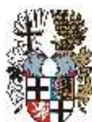
Familiáři Německého řádu