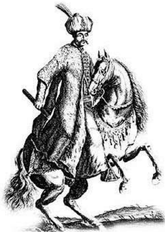
Kara Mustafa - the leader of Turks.

Vítězství nad Turky u Vídně patří mezi světlé okamžiky tehdejších polských dějin. Ale i evropských. Jan Sobieski nejen porazil turecká vojska, ale zajal i jejich vůdce Kara Mustafu . A zachránil tak Evropu před muslimy.