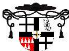
Římskokatol. farnost Bouzov